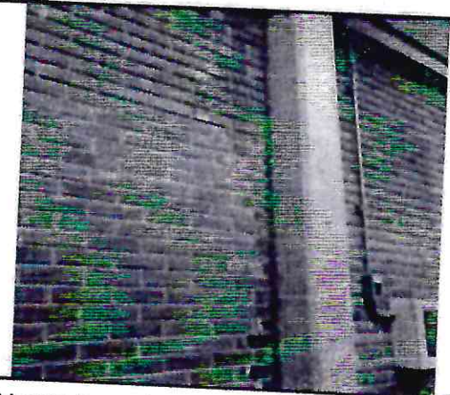
1.- Limpiar humedad en muros de petatillo en las áreas que lo necesiten y en pisos