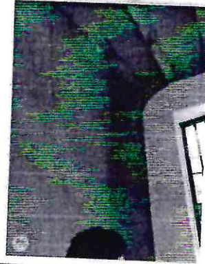
5.- Reparar Filtraciones en cubierta de Bovedilla NO ATENDIDA.