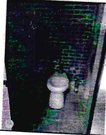
1.- Limpiar humedad en muros de petatillo en las áreas que lo necesiten y en pisos